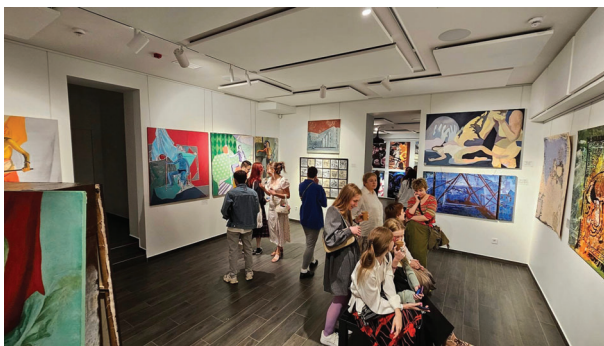
Іл. 6. «Школа». «Imagine point». 2024. https://www.facebook.com/photo/?fbid=7648303265236850&set=pcb.7648303628570147