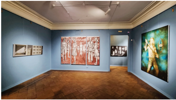
Іл. 4. «Відкритий простір. Хроніки переходу. Національний музей «Київська картинна галерея». 2023. https://www.facebook.com/photo/?fbid=903964710928461&set=pcb.903967134261552