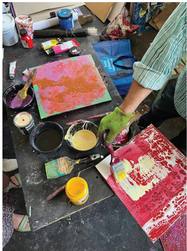
Іл. 13. Майстер-клас. Фактура в живописі. https://www.facebook.com/photo?fbid=1034293501228914&set=pcb.1034293604562237

на принципах довіри та взаємної поваги. У МФМ така спрямованість реалізована через лекції, майстер-класи (іл. 13), запрошення сучасних українських художників. Такі заходи спрямовані як для розкриття варіативності тенденцій світового сучасного мистецтва, так і на глибоке вивчення його засобів, які можуть бути застосовані у творчому процесі. Крім того, це сприяє кращому ознайомленню студентів з українським сучасним мистецтвом та його авторами.