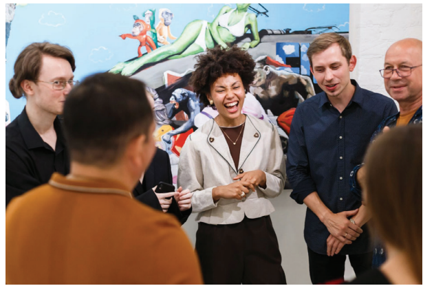
Іл. 1. «МФМ. Post-graduation». Галерея «Білий світ». 2021. https://www.facebook.com/photo?fbid=2984905845100198&set=pcb.2984907668433349

Виклад основного матеріалу. В Україні наразі існує понад сорок закладів вищої освіти, які проводять підготовку фахівців образотворчого мистецтва. Водночас серед абітурієнтів, які прагнуть стати професійними художниками та здобути диплом магістра, популярні