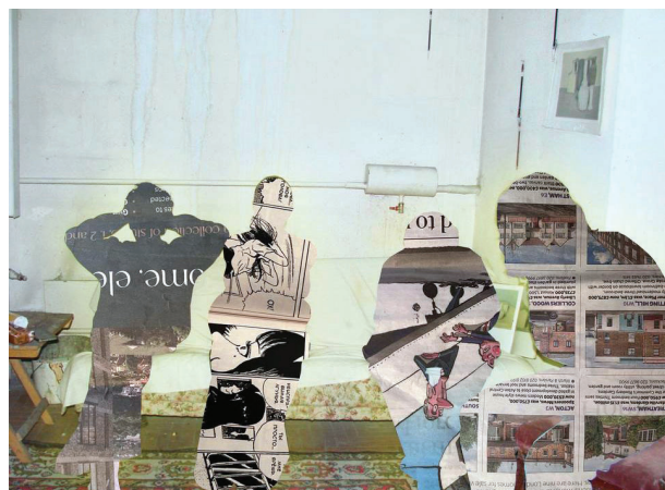
Іл. 19. Олександра Яковина. Цифровий колаж. 2024

цифрового колажу, відеоарту та 2D-анімації, які вони набували протягом першого курсу, але й змогли створити твори