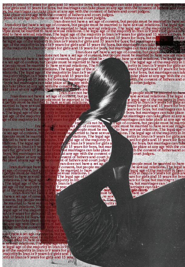
Іл. 18. Марія Ткаченко. Цифровий колаж. 2024