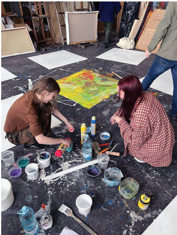
Іл. 15. Навчальний процес. 2024. https://www.facebook.com/photo/?fbid=1169122477746015&set=pcb.1169125854412344