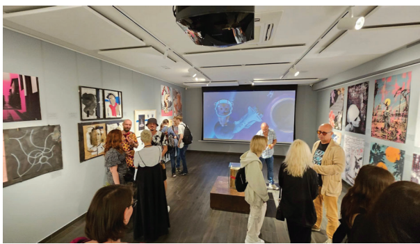
Іл. 5. «Школа». «Imagine point». 2024. https://www.facebook.com/photo/?fbid=7648303025236874&set=pcb.7648303628570147