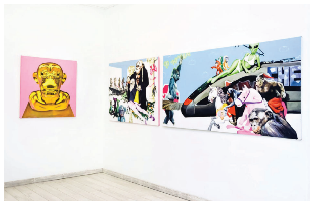
Іл. 2. «МФМ. Post-graduation». Галерея «Білий світ». 2021. https://www.facebook.com/photo/?fbid=2984906231766826&set=pcb.2984907668433349