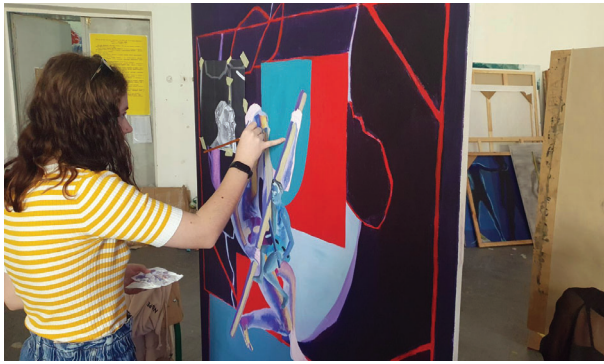
Іл. 14. Навчальний процес. 2023. https://www.facebook.com/photo/?fbid=710201117795543&set=pcb.710204481128540