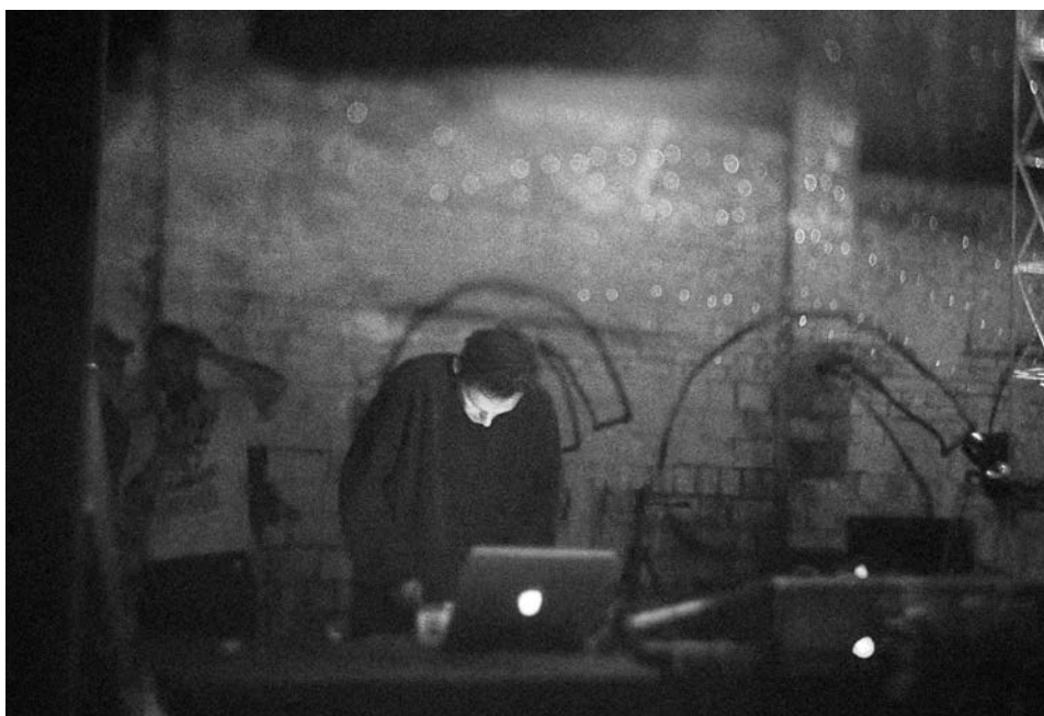
Carbon Art Lito 2020

створення візуальних ілюзій з використанням відеомепінгу та віджеїнгу, іммерсивних практик у різних видах мистецтва і, звісно, їхнього міксування. Митці прагнуть до самореалізації й уваги суспільства до створюваних ними мистецьких продуктів. Провідними темами творчих пошуків є екологія, гендерна рівність, рефлексія політичної ситуації в Україні та світі, проблема людей з інвалідністю.