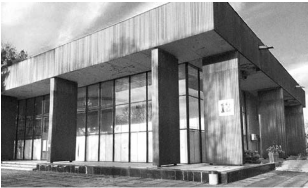
Загальний вигляд 13-го павільйону ВДНГ

позиція девелопера. Як відомо, девелопмент — розвиток територій, здійснення низки дій (проектних, будівельних тощо) з метою досягнення якісних змін земельних ділянок шляхом створення об'єктів нерухомості. На збільшення їхньої вартості і спрямована підприємницька діяльність девелопера. Тому позиція девелопера охоплює авторство ідеї (концепції) проекту, функції набувача земельної ділянки під забудову, інвестора, організатора процесів проектування, будівництво об'єкта, керуючого нерухомістю тощо.