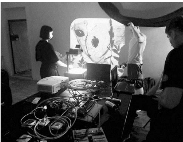
Медіа-експериментальна лабораторія «Технології та Творчість», 2018

Локація П13 виявилася придатною для розгортання експериментальних пошуків як для мистецьких, так і для практик креативних індустрій, що й обумовило головний зміст арт-девелоперського проекту «Карбон». Здійснені заходи продемонстрували можливості як окремої реалізації кожної з цих практик, так і їхнього симбіозу. Особливість арт-резиденції «Карбон» — освітнє підґрунтя у вигляді навчально-мистецьких лабораторій, діяльність яких підтримується та супроводжується різними форматами публічних заходів. Створення лабораторій можливе за умови наявності кураторів.