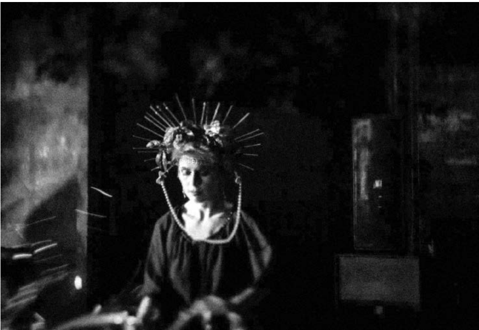
Поп ап фестиваль VITAL, 2020

Завдяки виваженим діям арт-девелопера до команди «Карбон» долучилося шість нових членів, серед яких контент-менеджер, двоє проєктних менеджерів, куратори аудіовізуальної, доповненої та віртуальної реальності, куратор саунд-арт-лабораторії, що допомагатиме системно реалізовувати події та арт-проєкти. У подальших планах «Карбону» — доопрацювання онлайн-платформи, розвиток саунд-арт-лабораторії, організація та проведення по Україні серії фестивалів сучасного медіаарту.