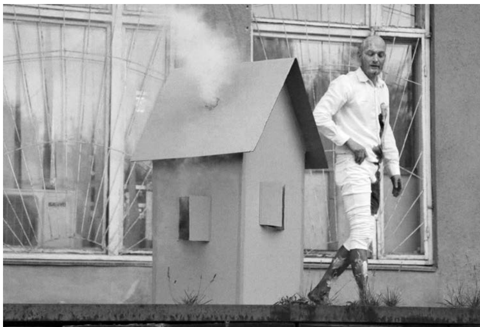
Фестиваль «Carbonarium 2019»

Сучасні технологічні можливості вражають і, звісно, мистецтво застосовує новітні засоби для самовираження, на кшталт віртуальної або доповненої реальності,